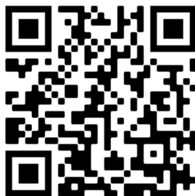
QR kód pre video návod